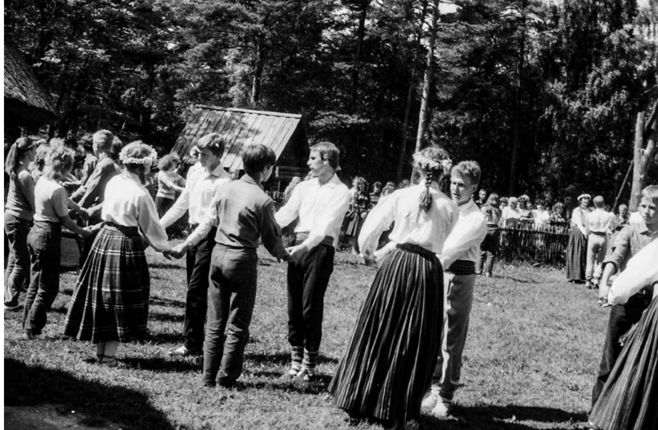
Deju folkloras kopa "Dandari" izbraukuma koncertā Igaunijas Brīvdabas muzejā Tallinā. 1984. gada 4. jūlijs