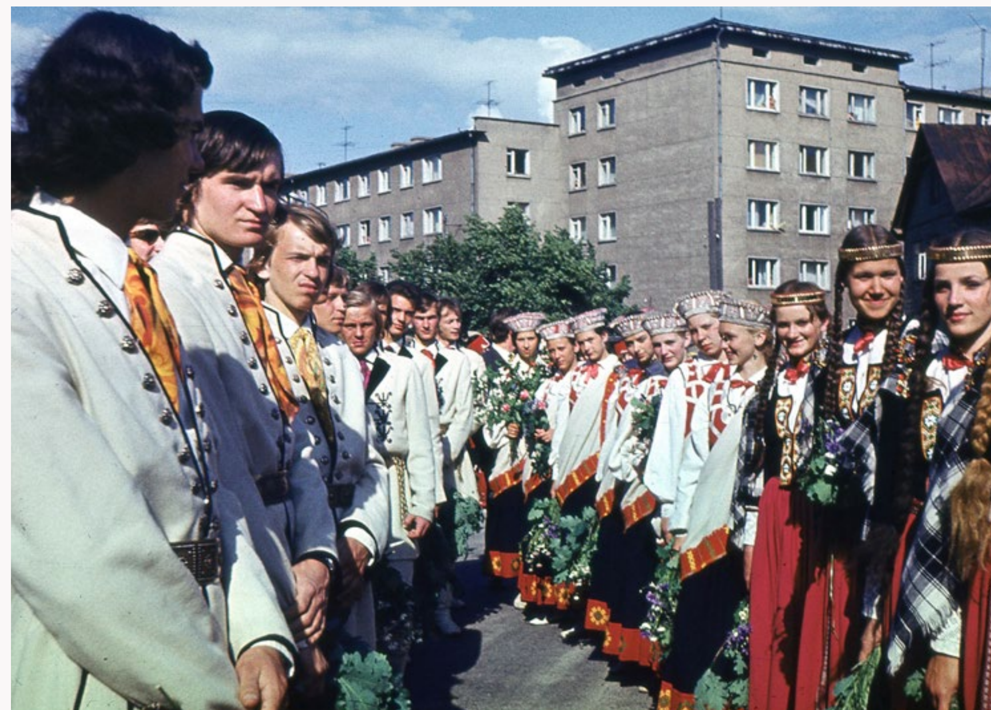
TDA "Dancis" svētku gājienā cauri Tartu