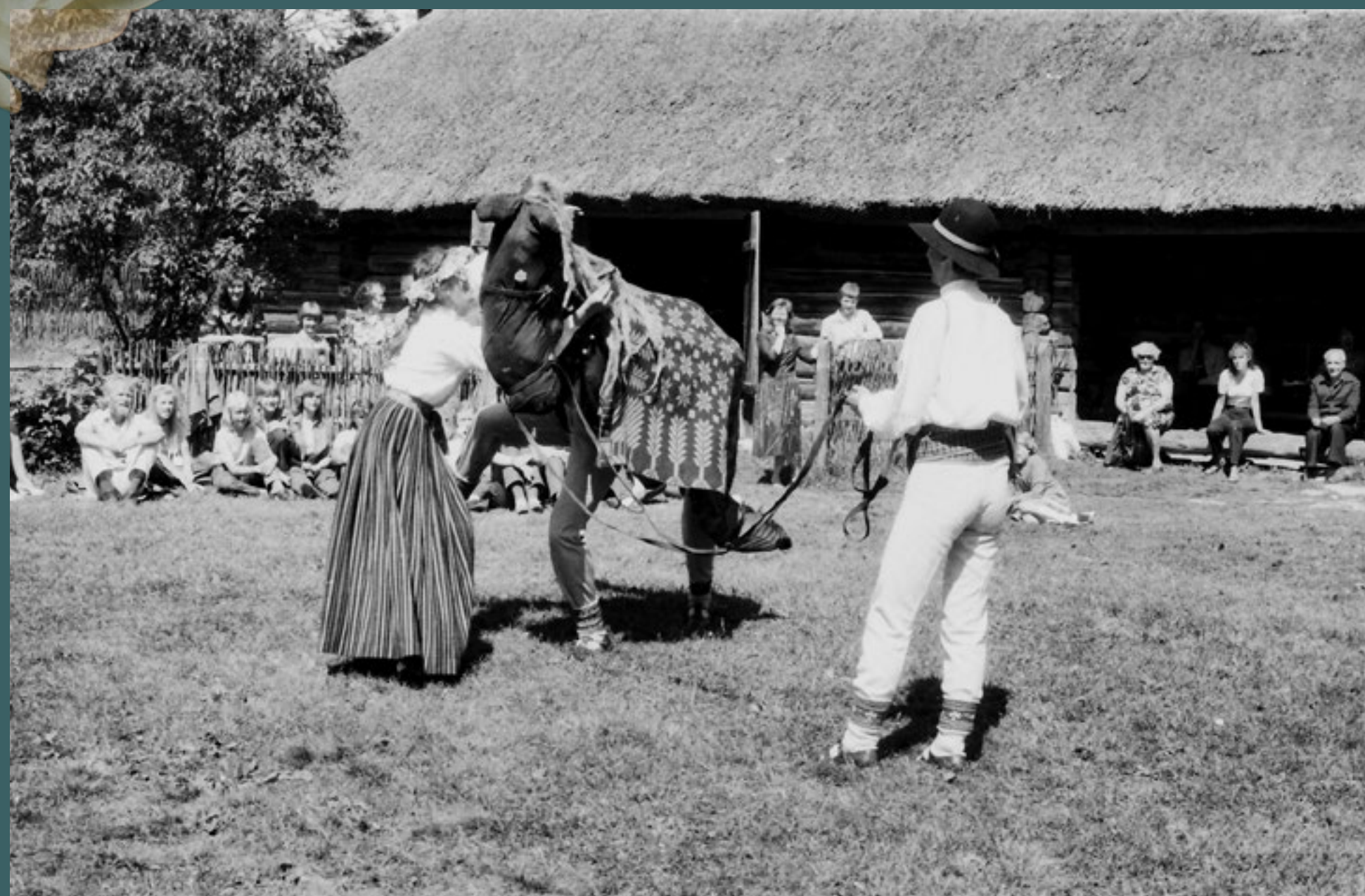
Un uz "skatuves" iznāk zirgs! Deju folkloras kopa "Dandari" izbraukuma koncertā Igaunijas Brīvdabas muzejā Tallinā. 1984. gada 4. jūlijs