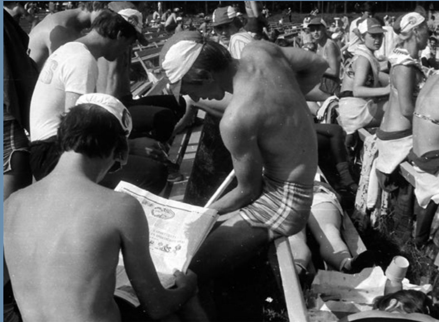
Starp priekšnesumiem atpūšoties var paspēt palasīt avīzi un nosauļot muguras. 1981. gads