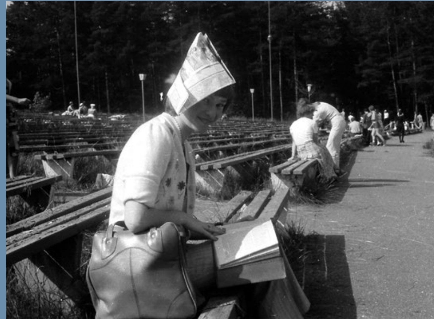
Mežaparka estrādē spīd spoža saule – jābūt radošiem, lai aizsargātos no saules dūriena! 1981. gads