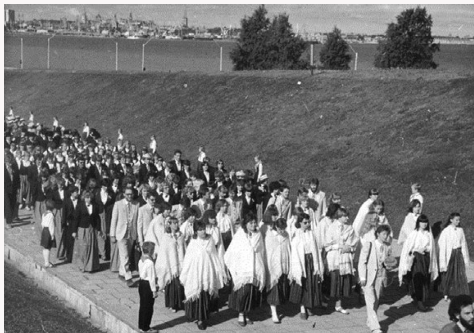
Gaudeamus XII svētku gājiens