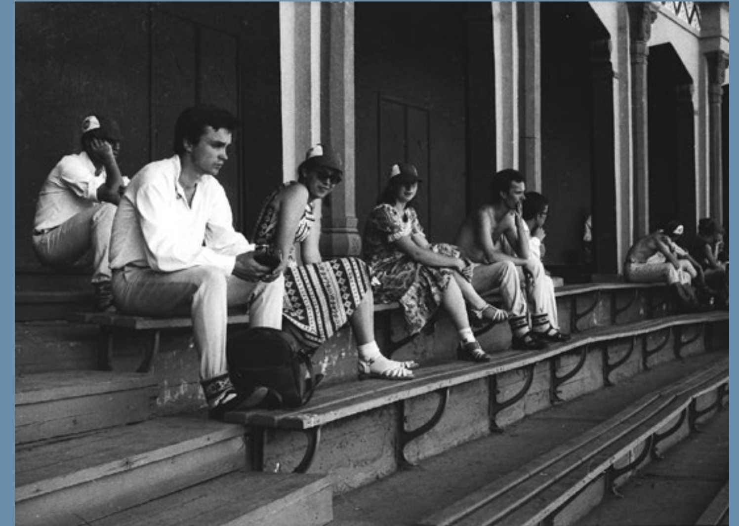
Dalībnieki slēpjas no saules estrādes augšējās solu rindās. 1981. gads