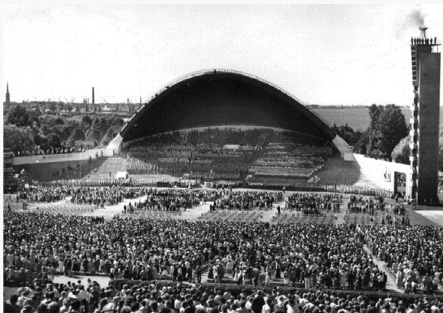
Tik daudz skatītāju un dalībnieku! Noslēguma koncerts Tallinas Dziesmu svētku estrādē