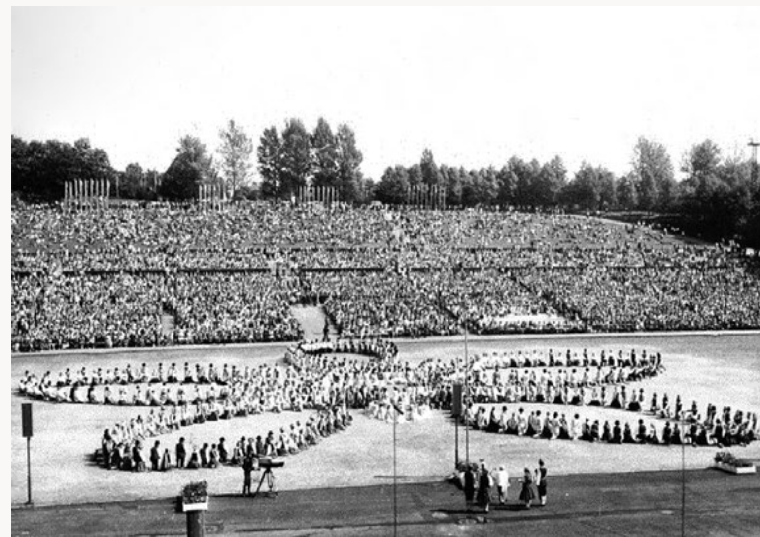
Dejotāji izkārtājušies rakstā – skaistā puķē. Noslēguma koncerts Tallinas Dziesmu svētku estrādē