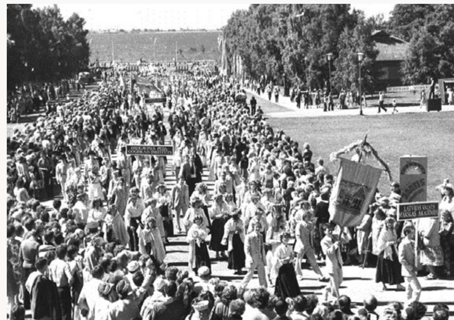
Dalībnieki no Latvijas pārstāv dažādas augstskolas. Gaudeamus XII svētku gājiens