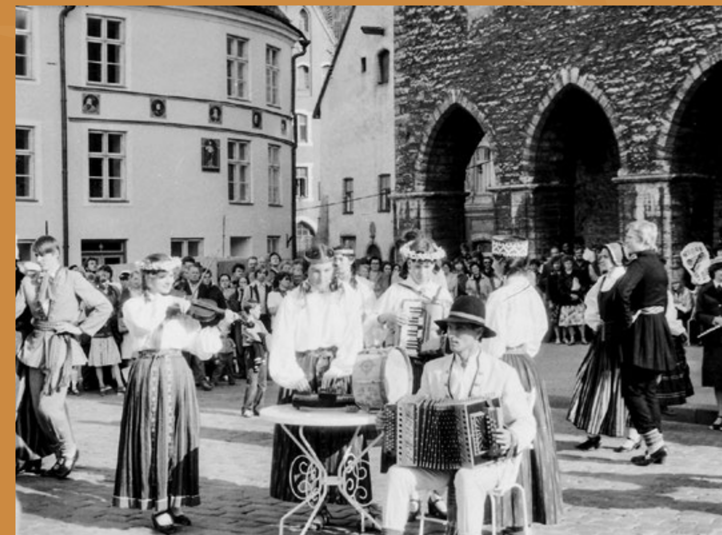
Cik skaisti ir dejot un muzicēt pašā Tallinas sirdī! Deju folkloras kopa "Dandari" koncertā Tallinas vecpilsētā pie Rātsnama. 1984. gada 5. jūlijs