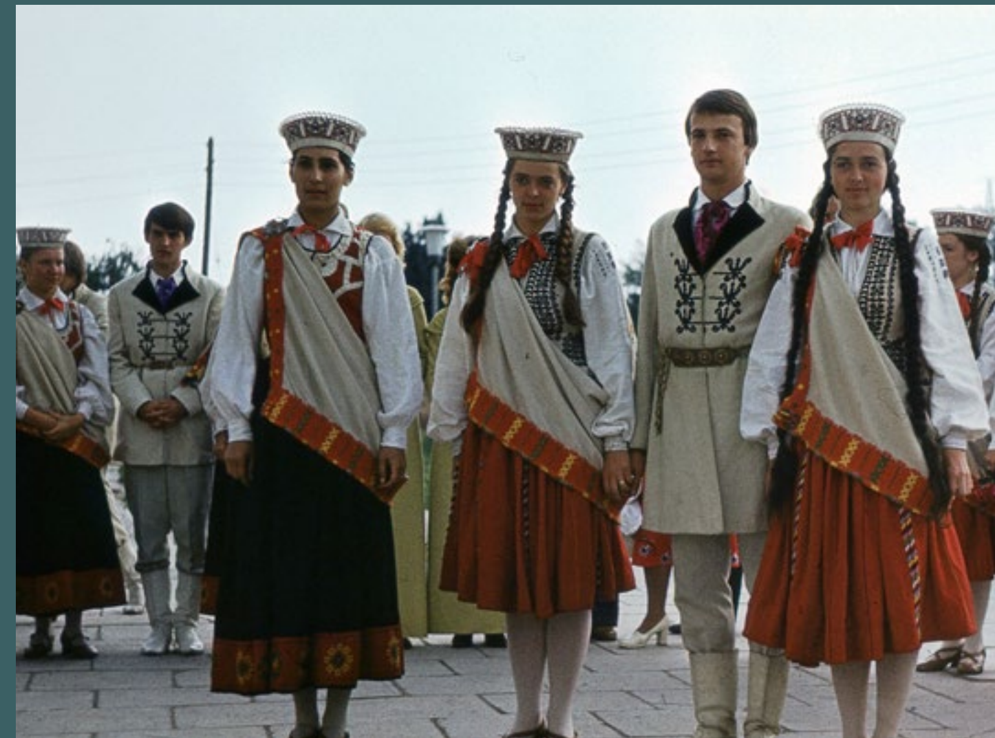
TDA “Dancis” dejotāji svētku gājiena laikā