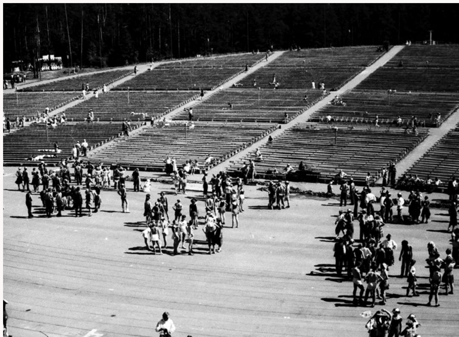
Dejotāji kā skudriņas Mežaparka estrādē gaida mēģinājuma sākumu. 1981. gads