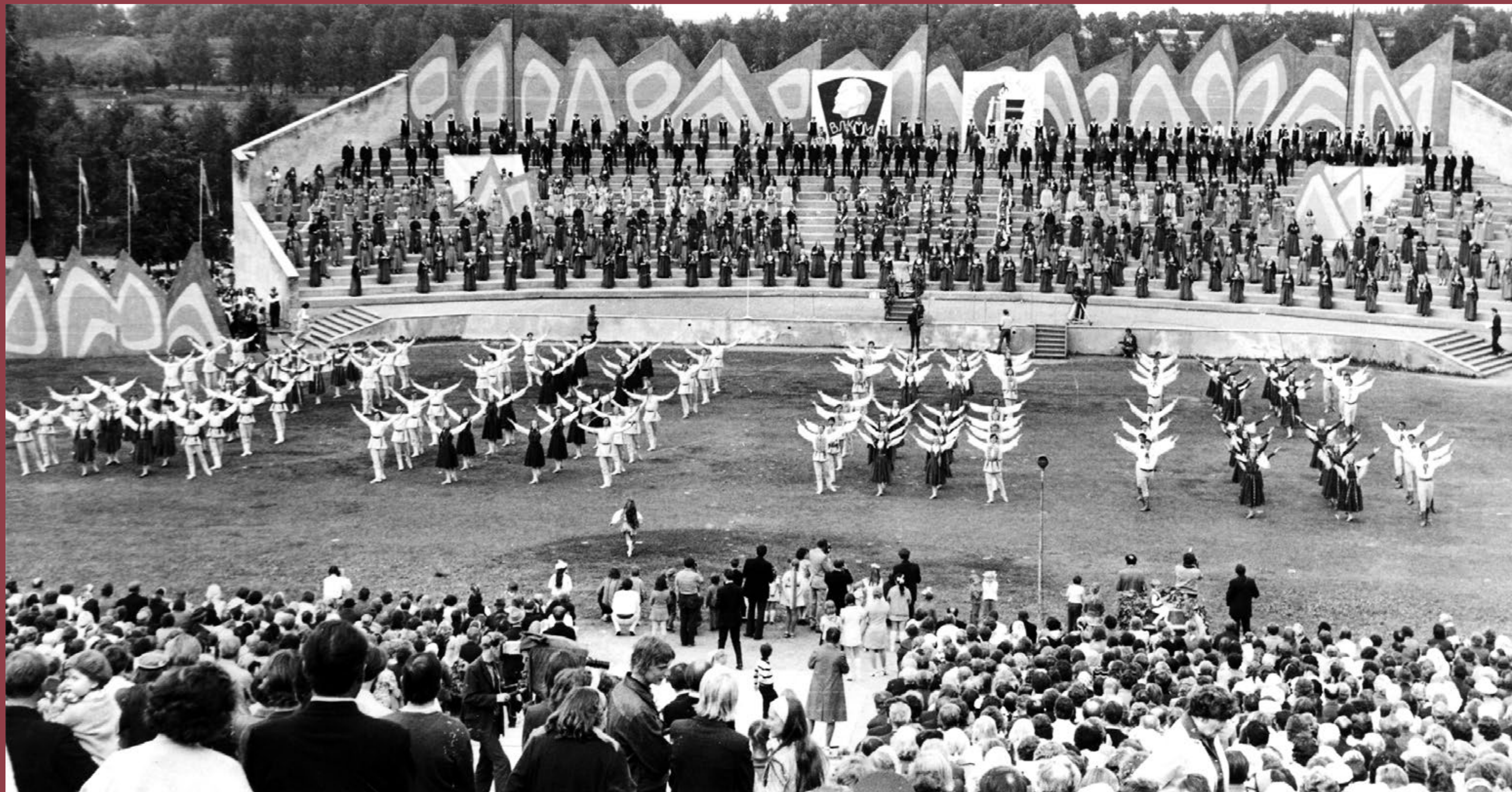
Dejas ritmos sitas mūsu sirdis! TDA "Dancis" Tatveres svētku parkā