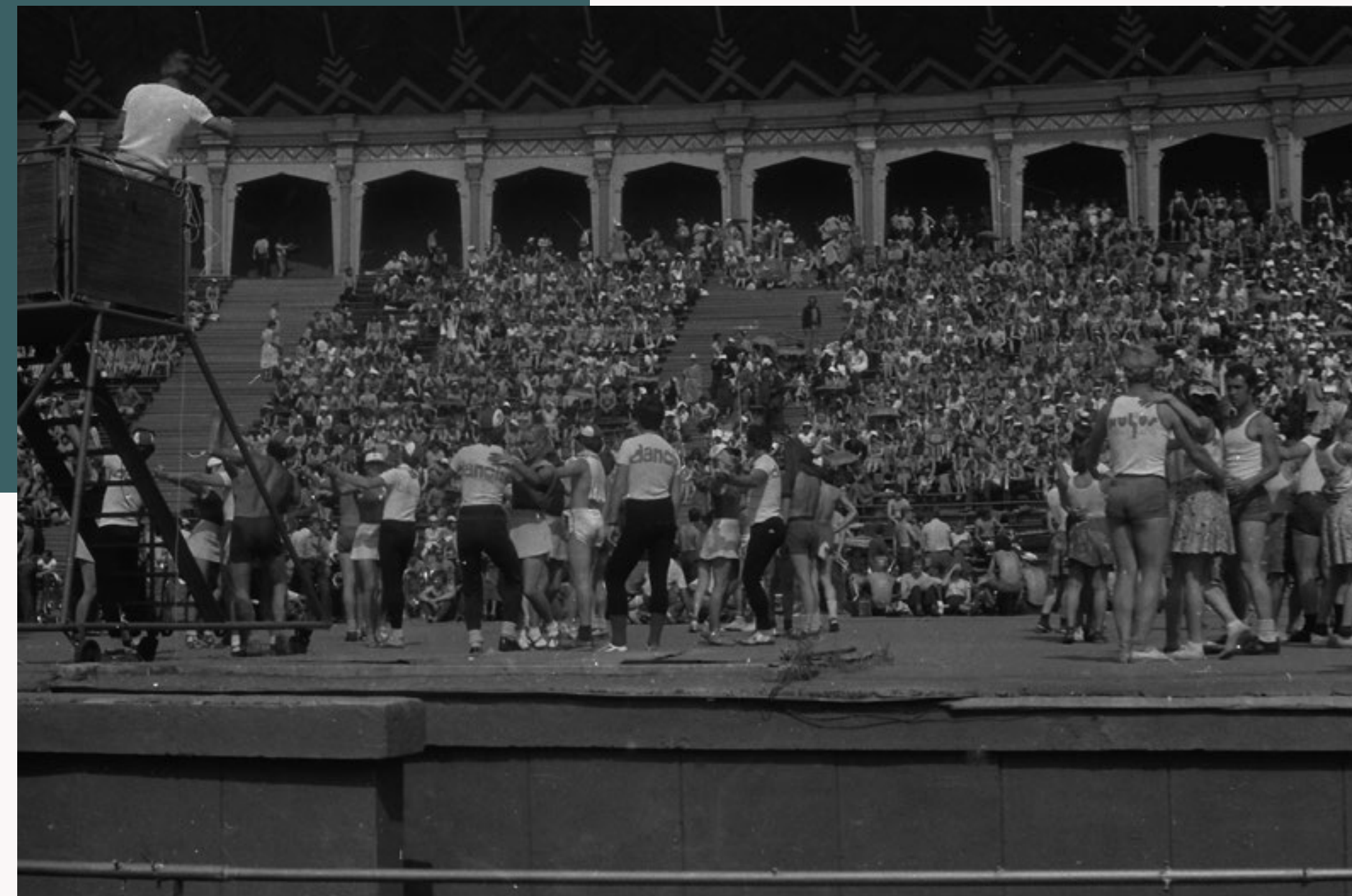
Mēģinājumā piedalās arī Latvijas Valsts universitātes Tautas deju ansamblis “Dancis” dalībnieki. 1981. gads