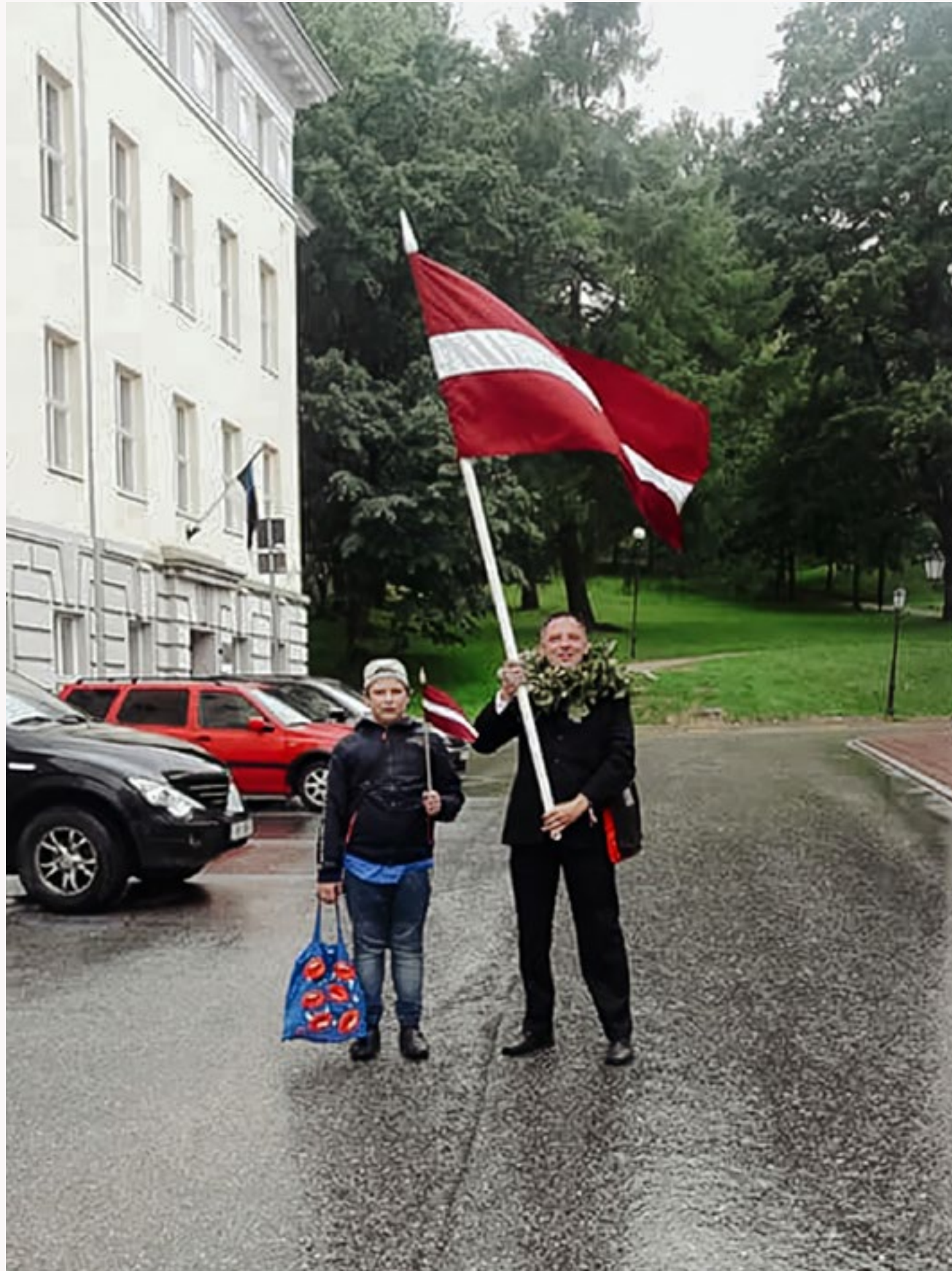
Skaisti plīvo Latvijas karogs! Tikpat skaisti tiek svinēti Jāņi, par ko liecina ozola lapu vainags vienam no kolektīva Jāņiem ap kaklu