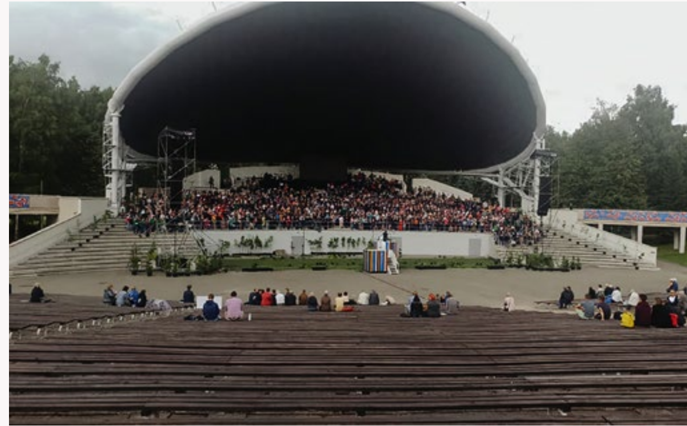
Mēģinājums festivāla noslēguma koncertam rit pilnā sparā!