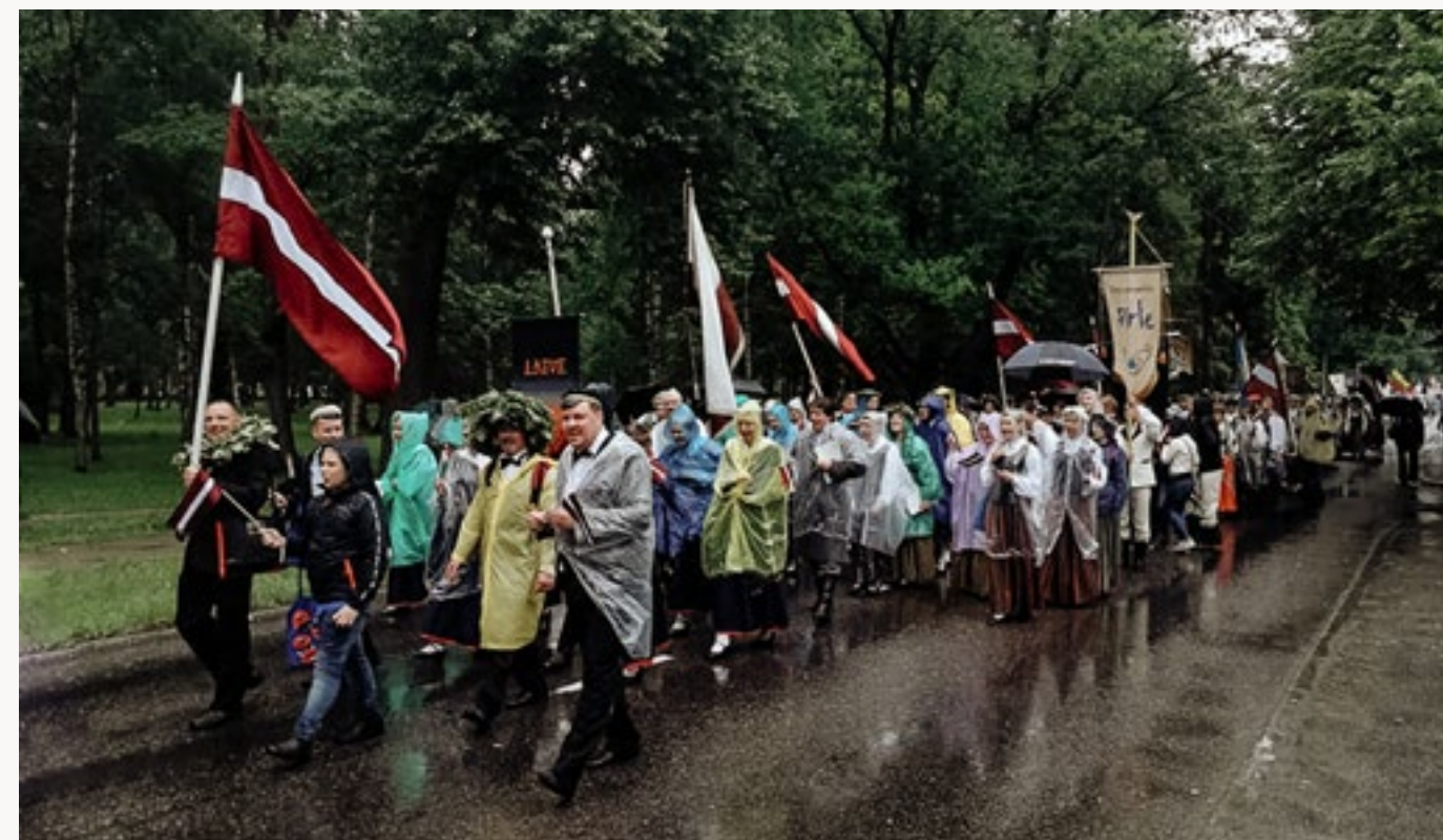
Prezidiju Konventa Vīru kora dalībnieki gājienā Gaudeamus XVIII festivālā. 2018. gads

Gaudeamus XVIII, 2018. gada 22.-24. jūnijs. Svētki norisinās Tartu, Igaunijā. Svētki tika veltīti Igaunijas Republikas 100. gadu jubilejai.