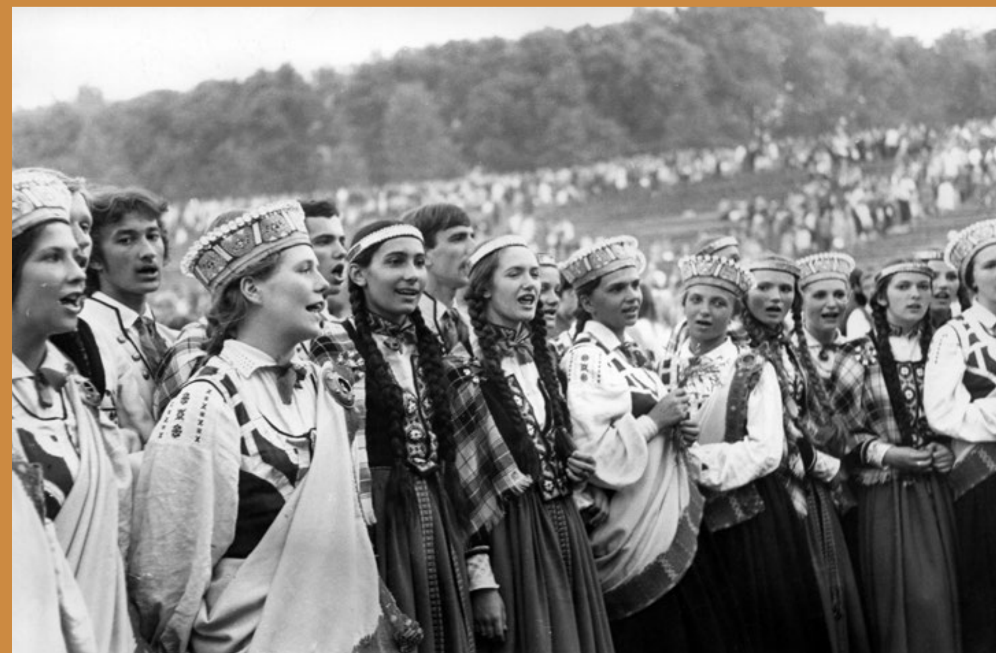
TDA "Dancis" pēc koncerta Tatveres svētku parkā