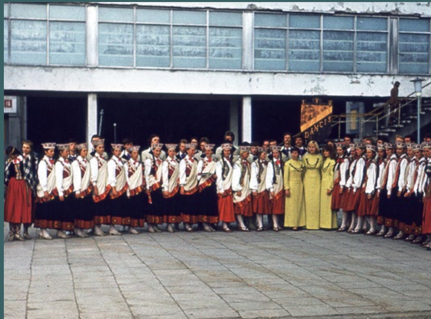
TDA “Dancis” kopā ar kolektīva vadītājiem Viļņā

“Gaudeamus VII” – 1978. gada 7.-9. jūlijs. Norisinājās Viļņā, svētkos piedalās ap 7000 dalībniekiem. Gala koncerti notiek stadionā “Žalgiris” un “Vingis” parka Lielajā estrādē.