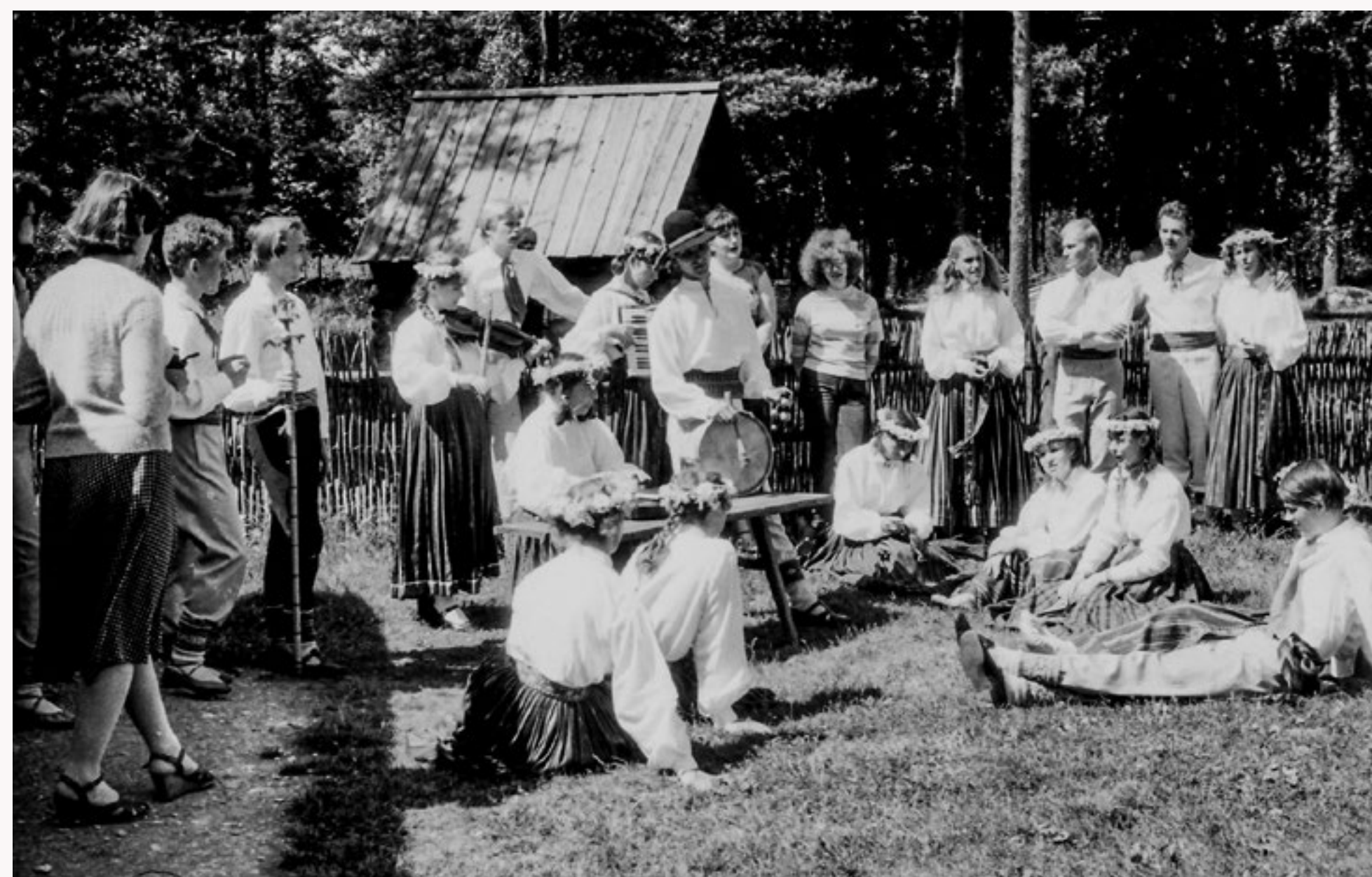
Deju folkloras kopa “Dandari” gatavojoties koncertam Tallinas Brīvdabas muzejā. 1984. gada 4. jūlijs