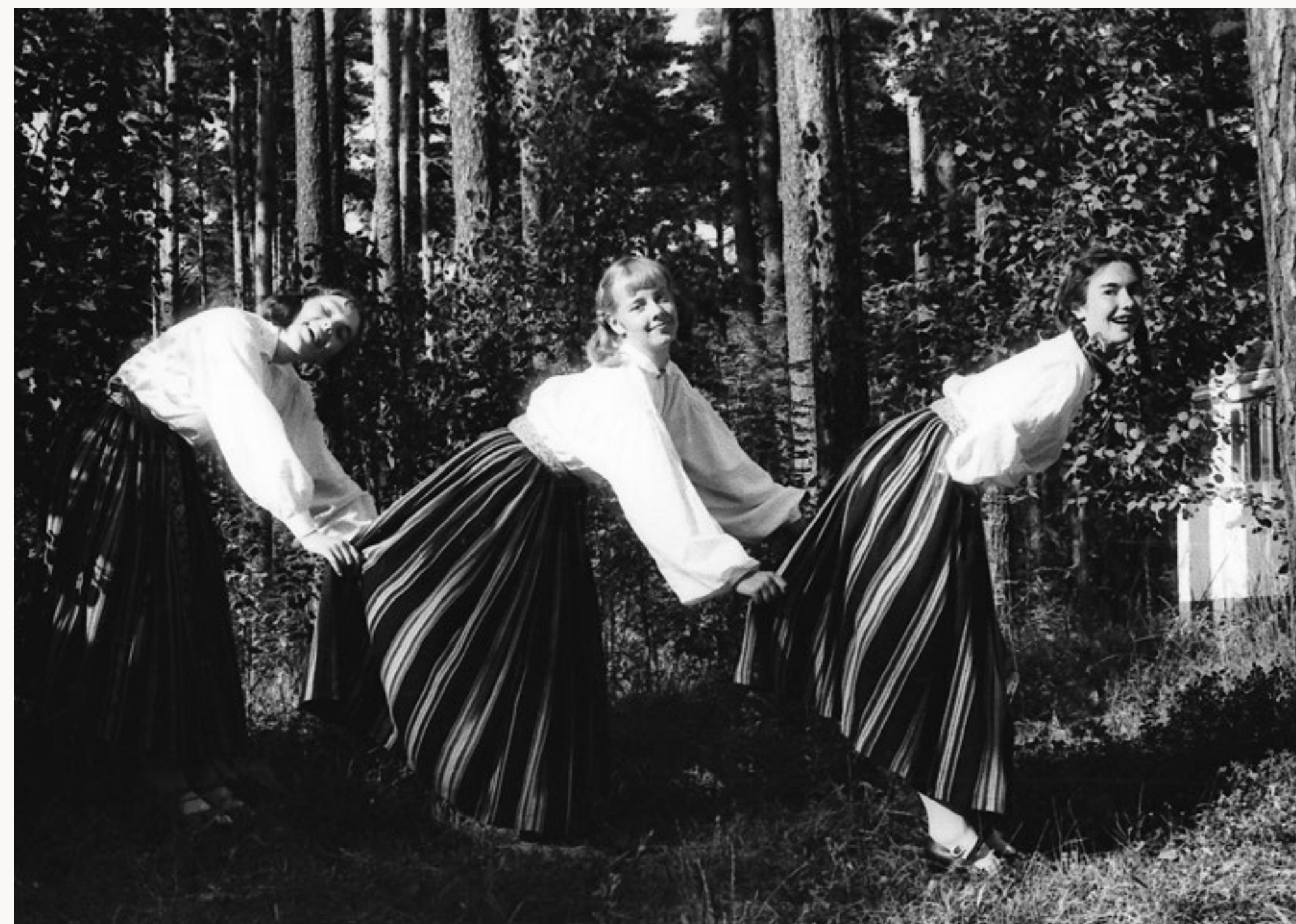
Deju folkloras kopas "Dandari" dalībnieces Mežaparkā. 1981. gads