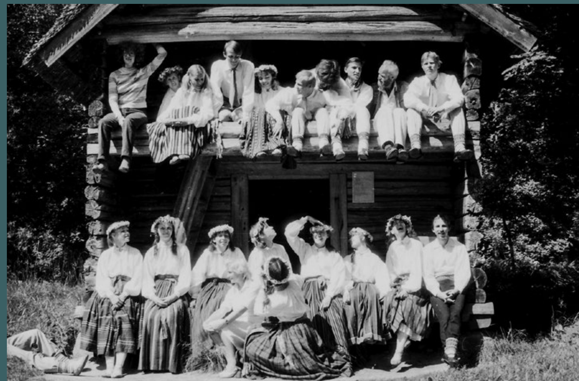
Deju folkloras kopa "Dandari" kopbilde pie guļbūves ēkas Igaunijas Brīvdabas muzejā Tallinā. 1984. gada 4. jūlijs