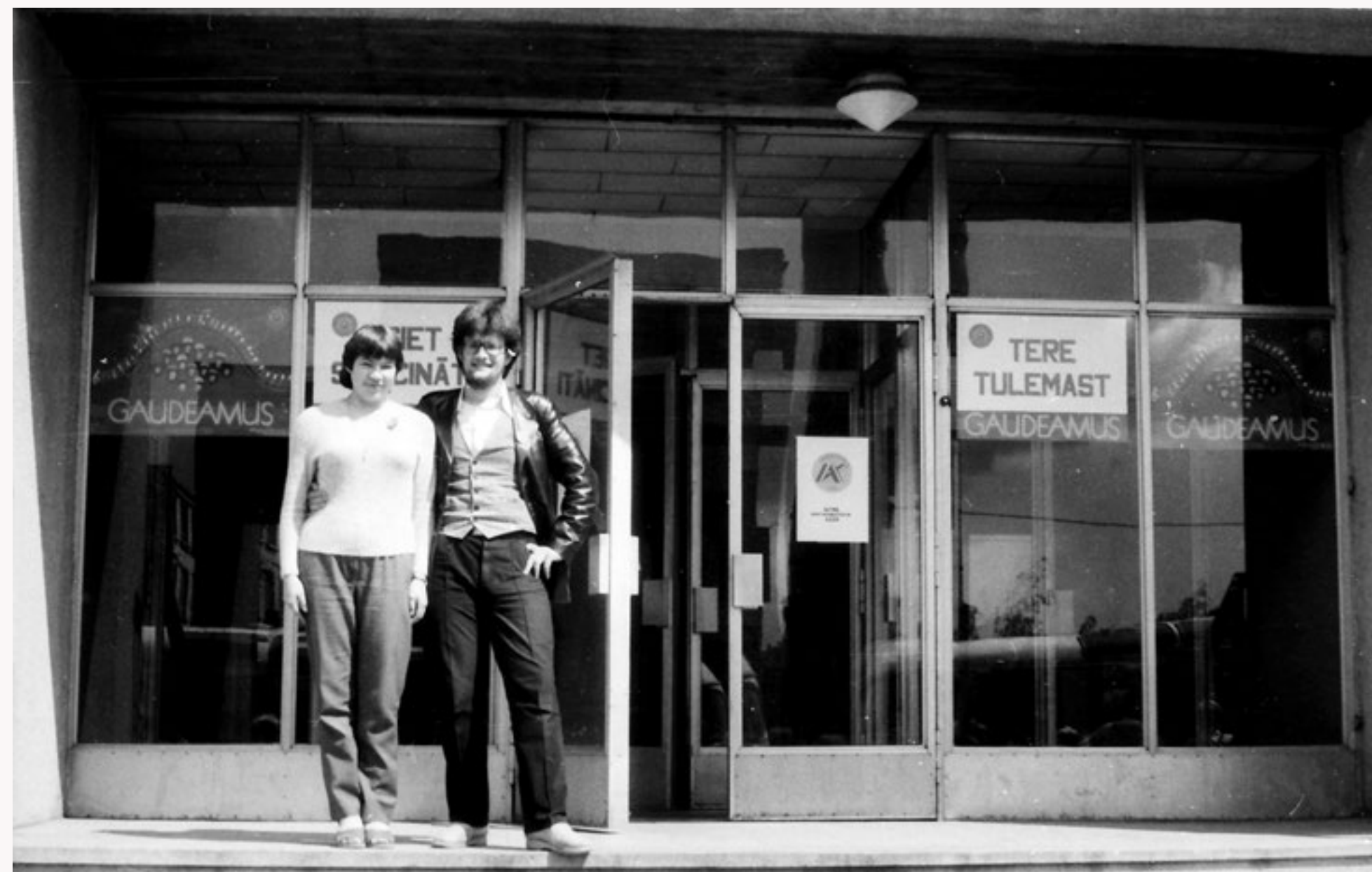
Esiet sveicināti, Gaudeamus IX dalībnieki! Ierašanās Igaunijā

Gaudeamus IX, 1984. gada 6.-8. jūlijs. Norisinās Igaunijas pilsētās Tartu, Kohla-Jarve un Pērnavā, noslēguma koncerts norisinās Tallinā, Tallinas dziesmu svētku estrādē. Šajos svētkos piedalījās vairāk nekā 6000 dalībnieku. Gaudeamus IX dalībnieku ziņā bija ļoti daudzšķautņaini – piedalījās gan dziedātāji un dejotāji, gan sportistu un moderno dejotāju grupas, kā arī pūtēju orķestri un folkloras mūzikas ansambļi. Fotogrāfijas no Aivara Narvaiša un Latvijas Universitātes kora “Jubilate” dalībnieces Velgas Grāveres personīgā arhīva.